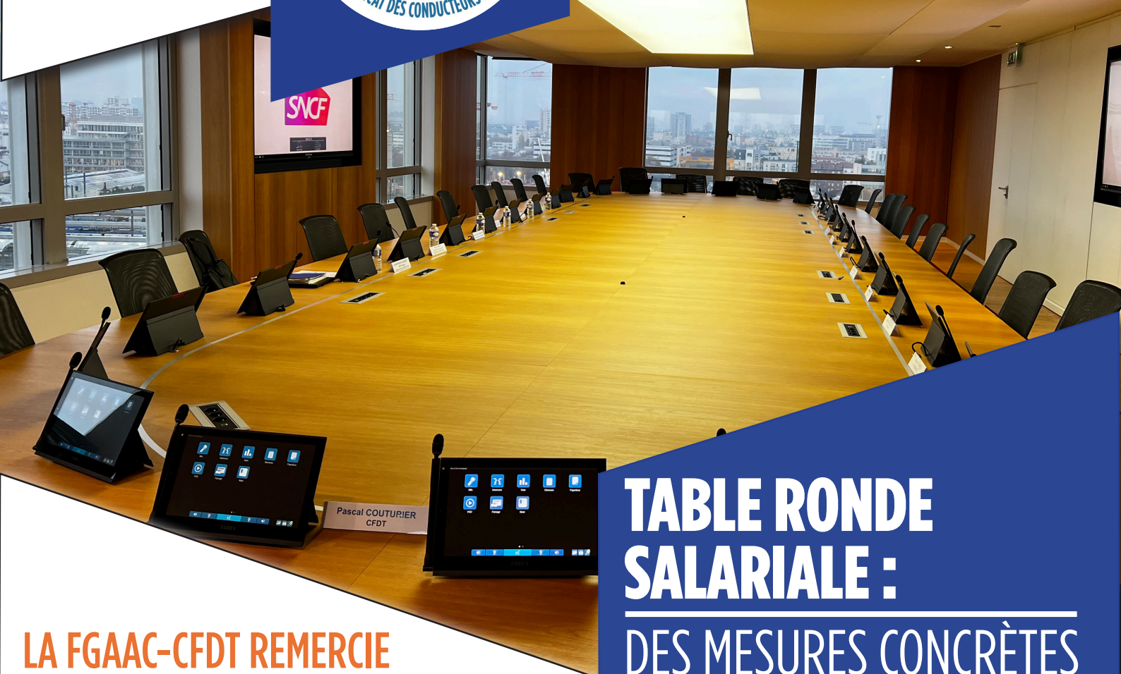
TABLE RONDE SALARIALE : DES MESURES CONCRÈTES POUR LES CONDUCTEURS !