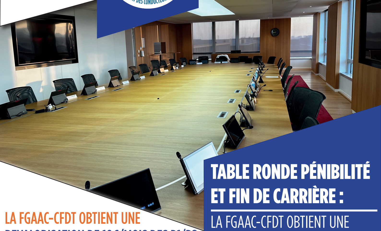
TABLE RONDE PÉNIBILITÉ ET FIN DE CARRIÈRE :

LA FGAAC-CFDT OBTIENT UNE REVALORISATION P1/P2 ET UN P3 !