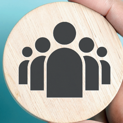
TABLE RONDE EMPLOI DU 29 MAI 2024 :

UNE BRIQUE MAJEURE DE LA PLATE-FORME DE PROGRÈS SOCIAL !