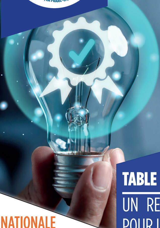
TABLE RONDE ENCADREMENT : UN RENDEZ-VOUS IMPORTANT POUR LES CADRES TRACTION !