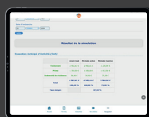
Accès aux simulateurs CAA et mutuelle